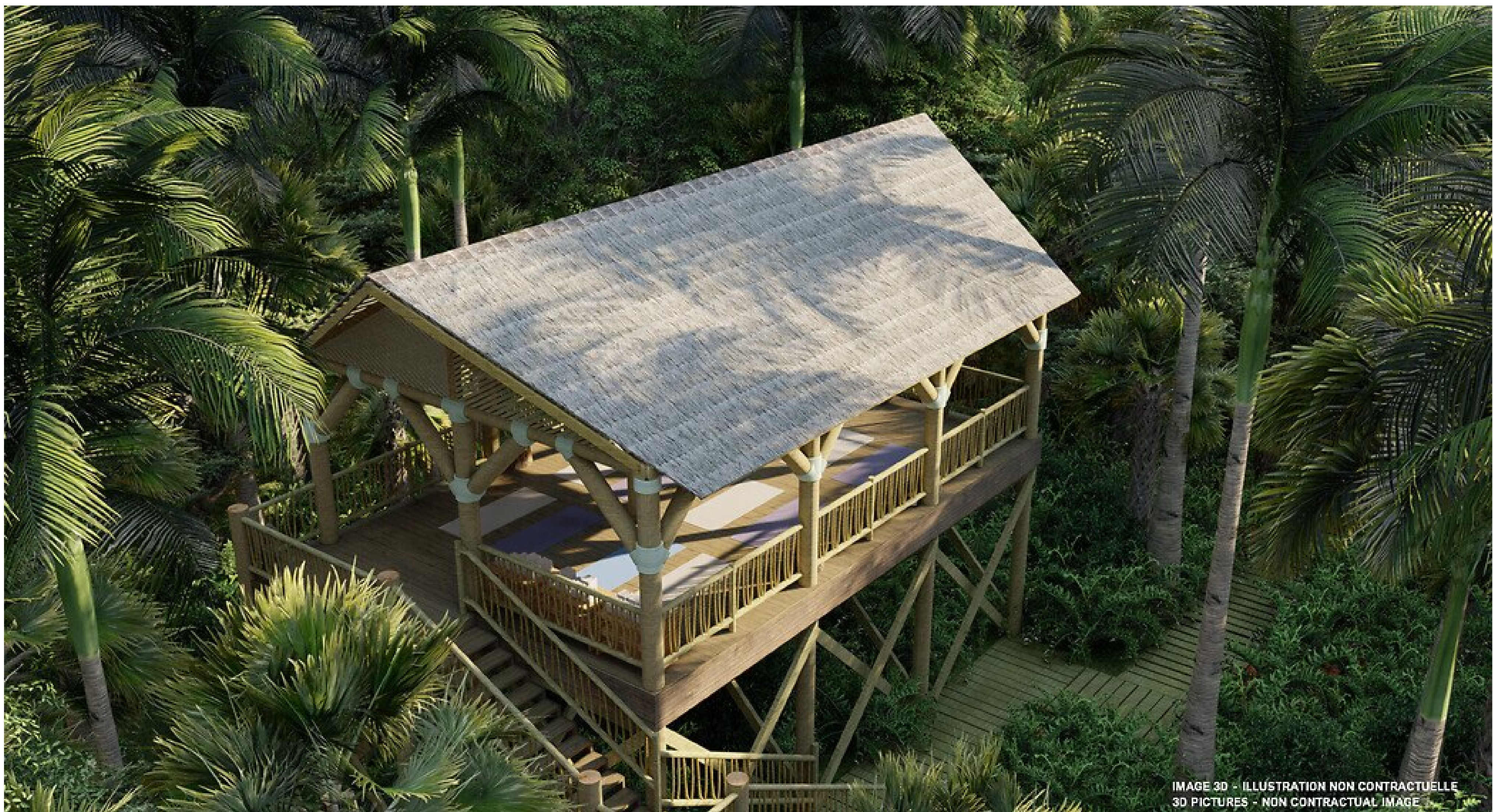
IMAGE 3D - ILLUSTRATION NON CONTRACTUELLE 3D PICTURES - NON CONTRACTUAL IMAGE