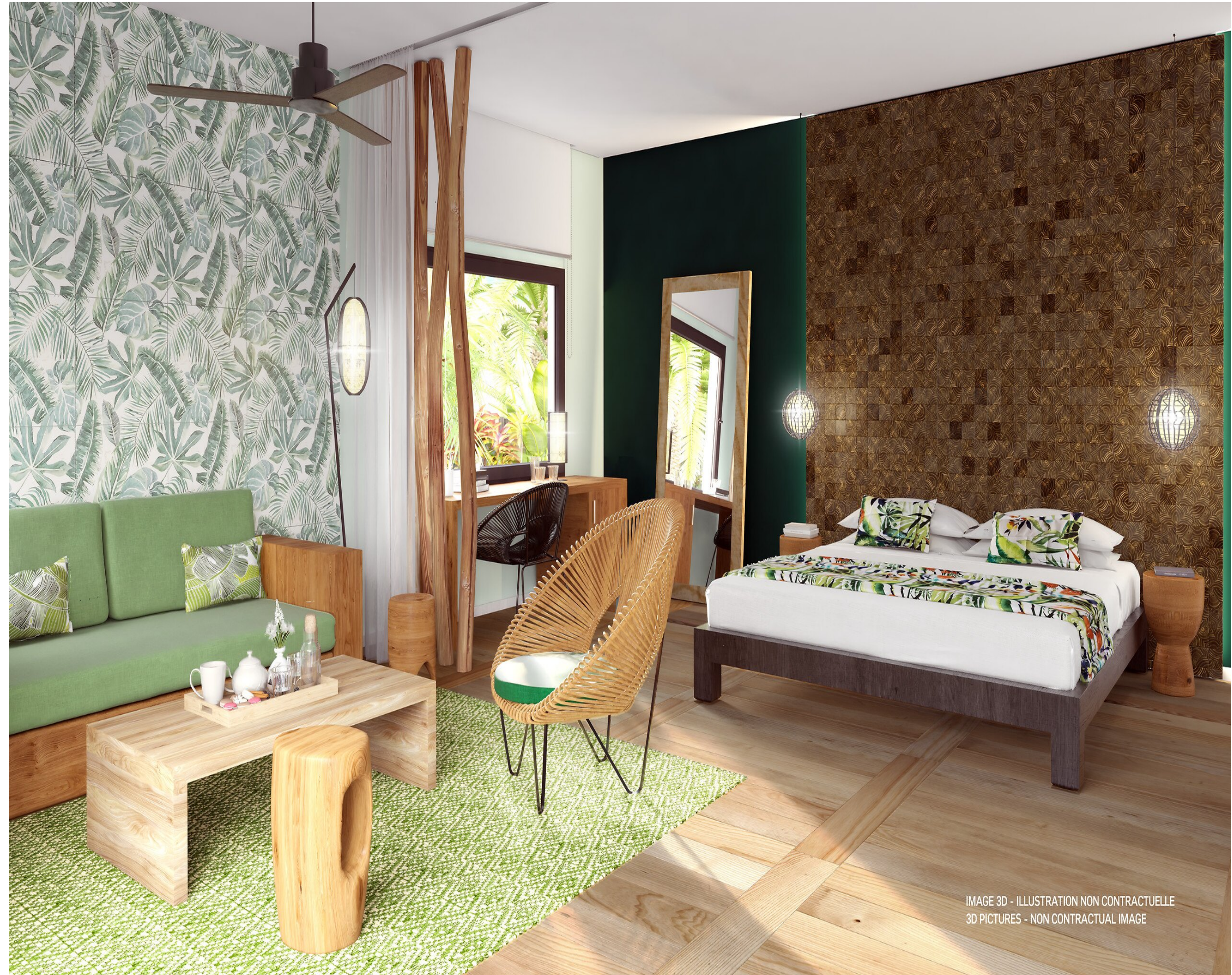
IMAGE 3D - ILLUSTRATION NON CONTRACTUELLE 3D PICTURES - NON CONTRACTUAL IMAGE