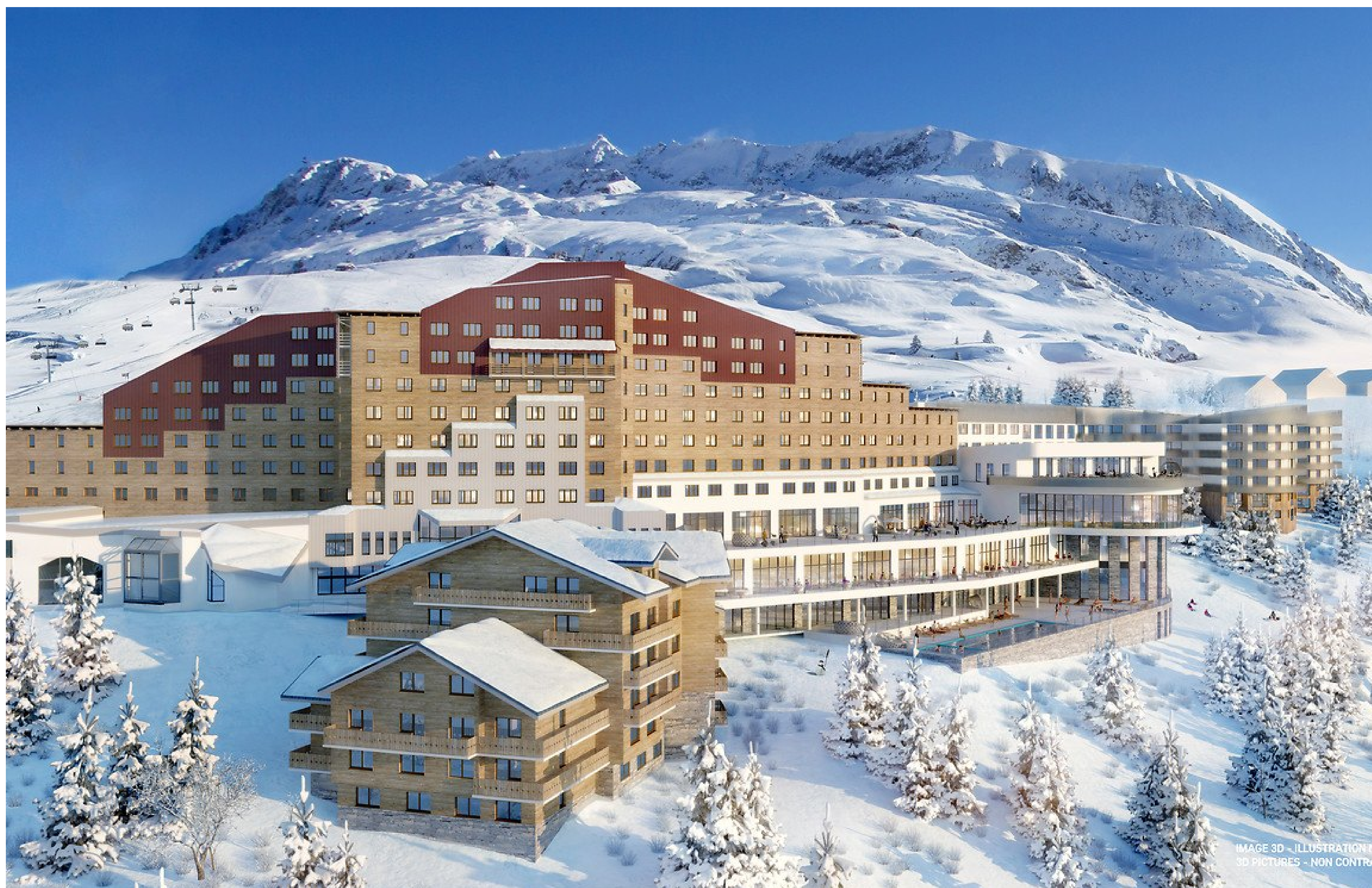
IMAGE 3D - ILLUSTRATION EN 3D PICTURES - NON CONTRACTUELLE